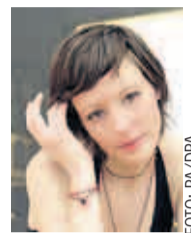
Schauspielerin Lavinia Wilson

Heute Abend feiert sie in einem Kreuzberger Restaurant in ihren 29. Geburtstag hinein. „Ich habe meine acht liebsten Freunde eingeladen“, sagte Lavinia Wilson („Julietta“, „Schussangst“) gestern in einer Drehpause. Sie absolvierte in Köln den letzten Dreh für den Film „Die Sekretärin“ (Sendetermin: voraussichtlich im Herbst im Ersten). „Die Sekretärin“ ist ein Wirtschaftsthiller.